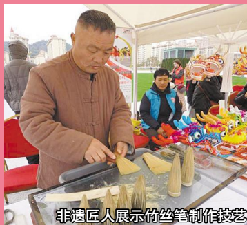
非遗匠人展示竹丝笔制作技艺