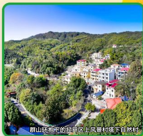
群山环抱下的经开区上凤景村塔下自然村