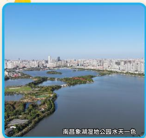
南昌象湖湿地公园水天一色