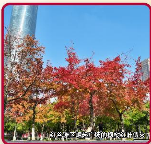
红谷滩区崛起广场的枫树红叶似火